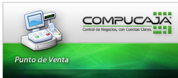
Imagen 1.0 Proceso de acceso al Punto de Venta.

En primera instancia, se mostrará la siguiente imagen correspondiente a la verificación de licenciamiento, y carga de datos de configuración.