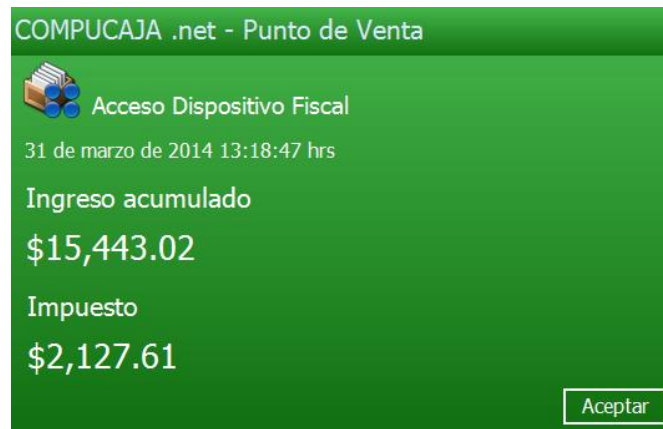
Imagen 1.5 Información del PDV para la SAT.

Al presionar el botón Aceptar o la tecla ESC , la sesión habrá finalizado. Si quiere consultar de nuevo alguna información, el auditor tendrá que iniciar sesión nuevamente.