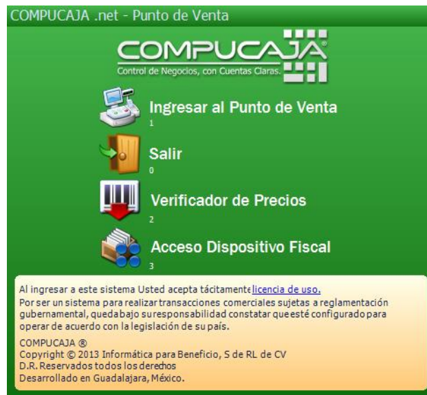
Imagen 1.1 Proceso de acceso al Punto de Venta.

De inmediato envía ésta siguiente pantalla con las opciones para ingresar (presionando la tecla numérica 1), Salir (0), utilizar únicamente el Verificador de Precios (2). La última y necesaria para éste proceso es la opción Acceso Dispositivo Fiscal (3) ; además de los datos informativos del Licenciamiento y Derechos de uso del sistema.