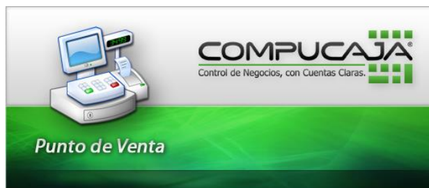
Imagen 1.1 Proceso de acceso al Punto de Venta.

En primera instancia, se mostrará la siguiente imagen correspondiente a la verificación de licenciamiento, y carga de datos de configuración.