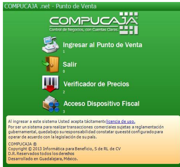
Imagen 1.2 Proceso de acceso al Punto de Venta.

Como se puede verificar en la siguiente imagen, el sistema mostrará la nueva opción Acceso dispositivo fiscal (presionando la tecla numérica 3).