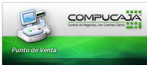
Imagen 1.1 Proceso de acceso al Punto de Venta.

En primera instancia, se mostrará la siguiente imagen correspondiente a la verificación de licenciamiento, y carga de datos de configuración.