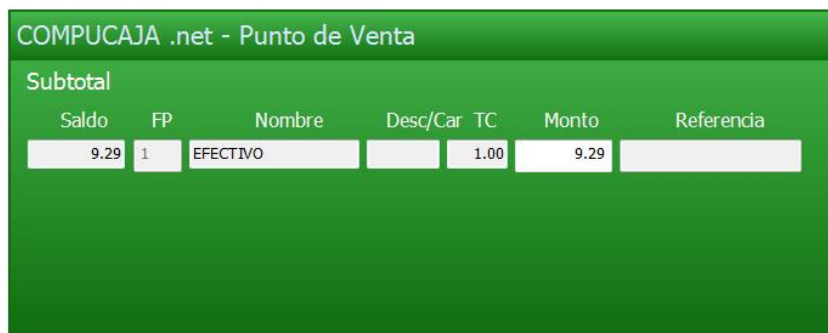
Imagen 1.152 Cierre de transacción.

Se finaliza la venta como cualquier otra.