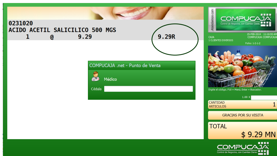
Imagen 1.4 Seleccionar Médico.

Al momento de querer cerrar la venta, aparecerá en primera instancia la ventana donde se seleccionará el médico que ordenó dicha receta, bastará con posicionarse en el campo, y presionar ENTER para que se habilite el buscador.