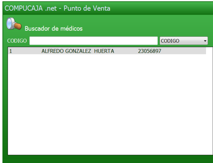
Imagen 1.151 Buscador de Médicos.

Se finaliza la venta como cualquier otra.